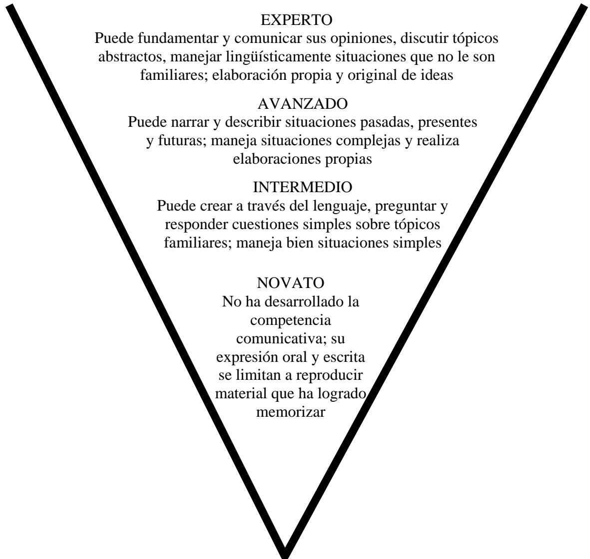
Figura 5.2 Niveles de desempeño: competencia comunicativa general